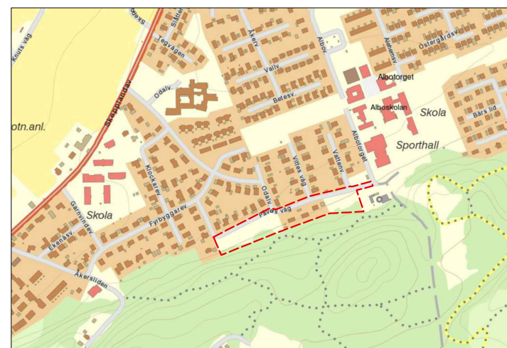
Planområdets lokalisering i Skepplanda