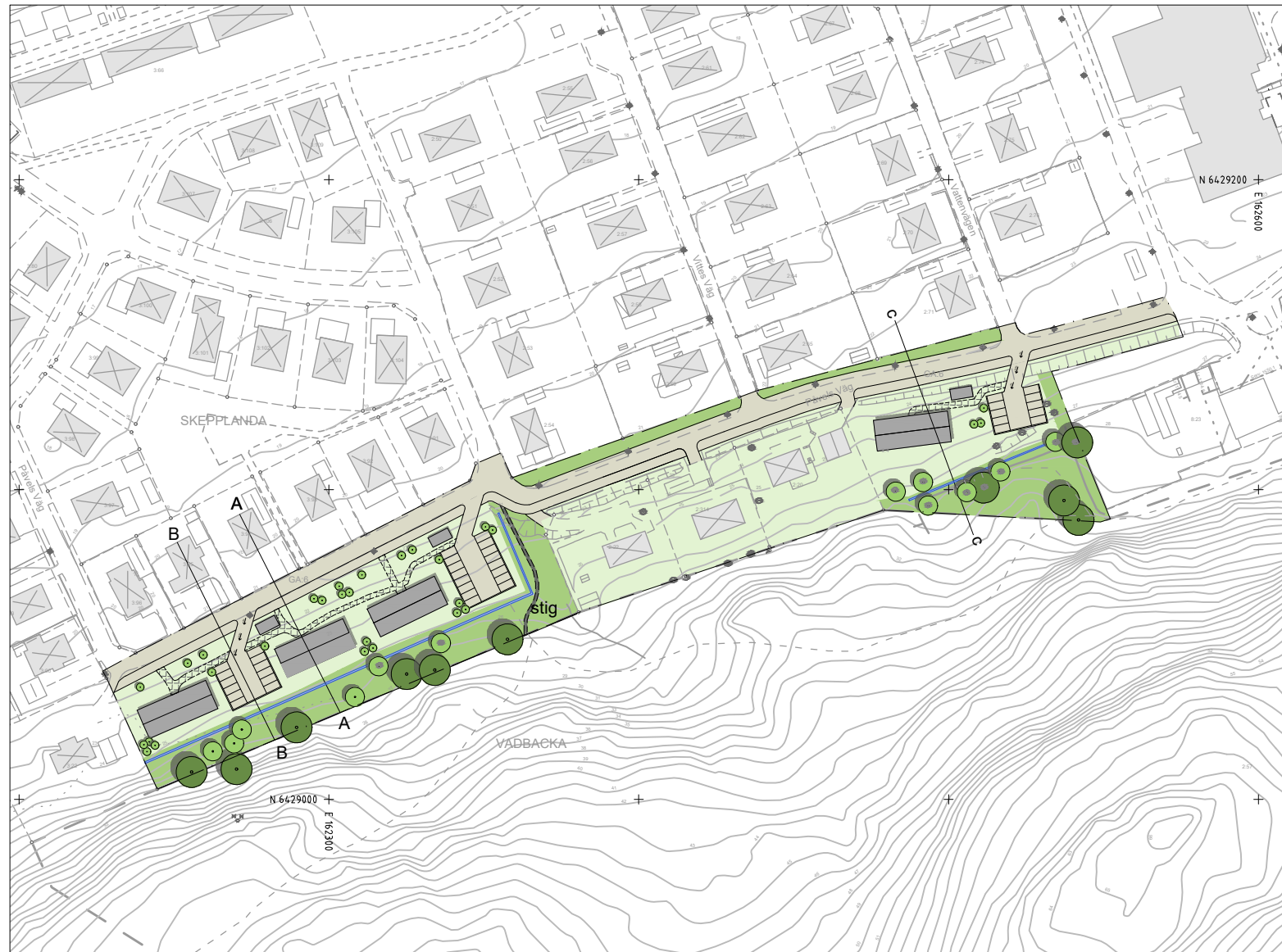
Skala 1:2 000 (A3) 0 10 50 100 m