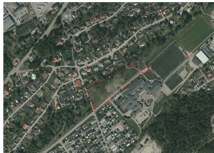
Planområdets lokalisering i Älvängen