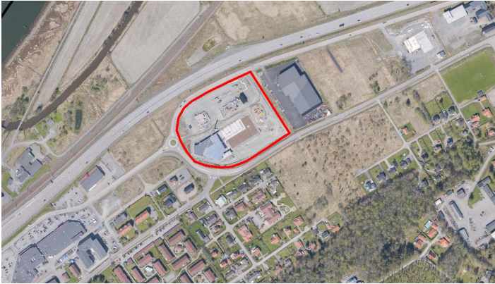
Ortofotot visar fastigheten Svenstorp 1:173 som omfattas av ändringen.