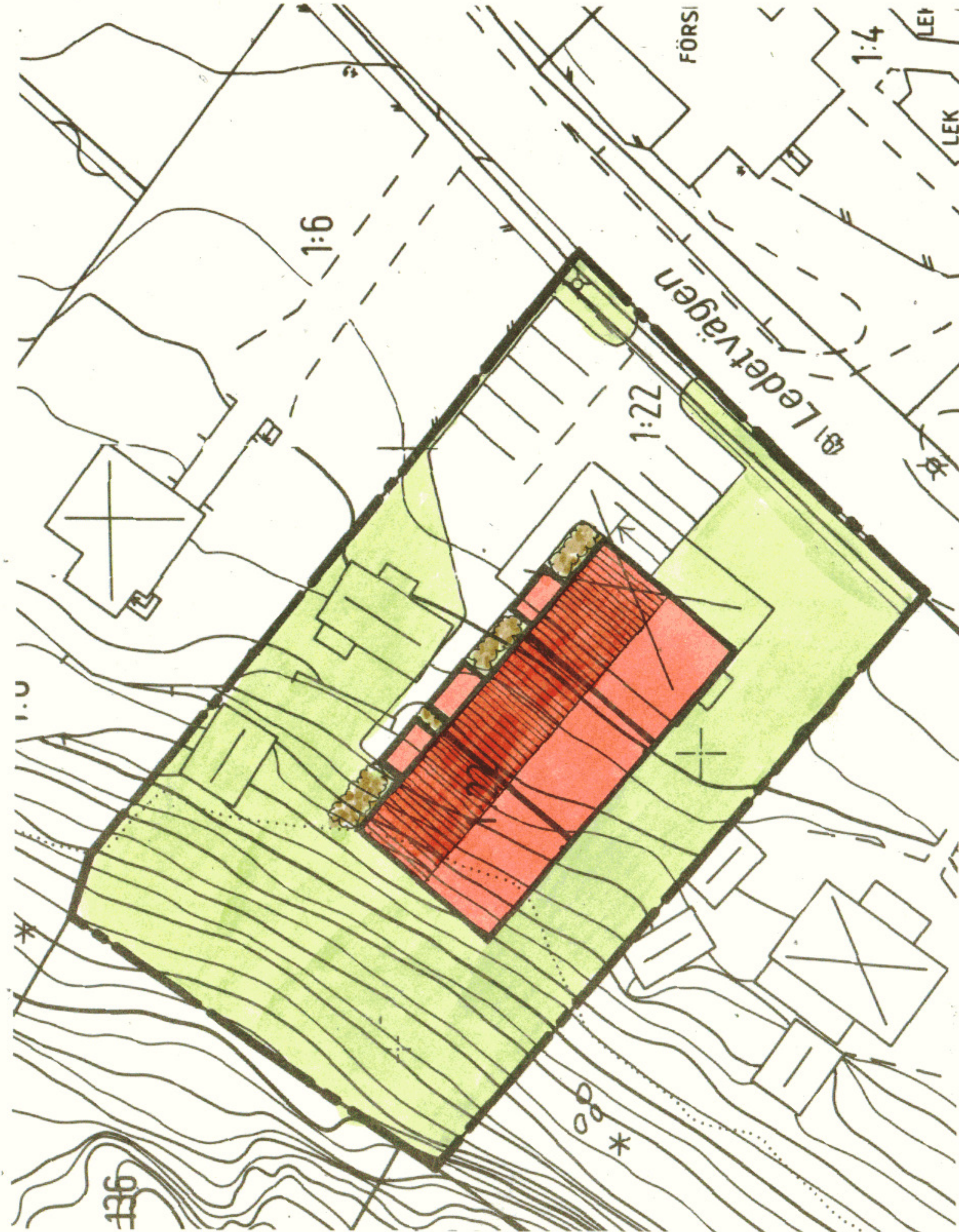
ILLUSTRATIONSKARTA skala 1:400