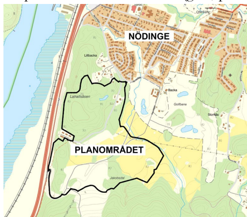
Planområdets läge och ungefärliga avgränsning.

Planområdet är ca 60 hektar stort och ligger söder om Nödinge tätort. Planförslaget omfattar utbyggnadsområde enligt översiktsplanen (ÖP21) och är i linje med fördjupad översiktsplan för Nödinge (FÖP Nödinge 2030). Planen bedöms kunna innebära betydande miljöpåverkan och en miljökonsekvensbeskrivning har därför upprättats. Förslaget innebär också att mark kommer att tas i anspråk för allmänt ändamål (gata, park och natur).