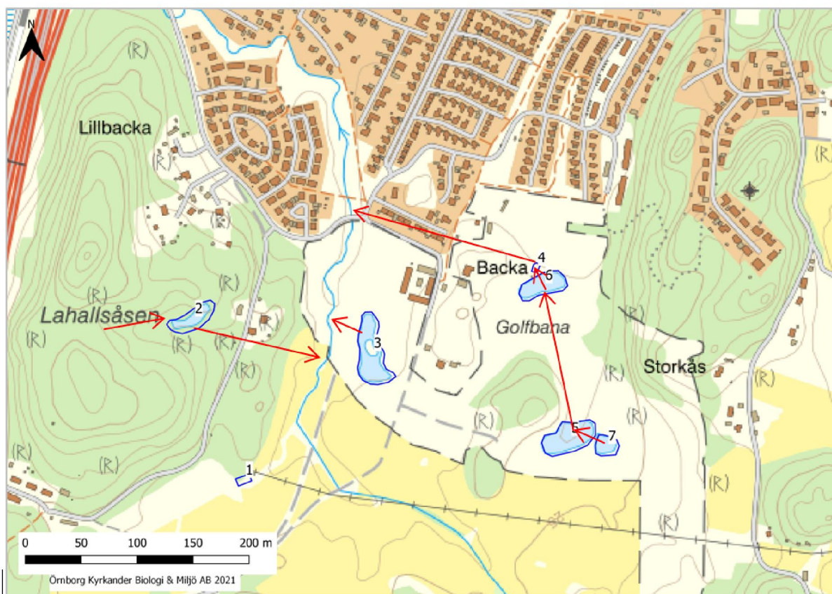
Figur 1. Inventerade dammar numrerade från 1–7, söder om Nödinge. Röda pilar representerar schematisk avrinning från respektive damm till Lodingebäcken som i sin tur mynnar i Göta älv.

Ale kommun arbetar med en detaljplan för ett område omfattande bl.a. fastigheten Nödinge-Stommen 1:261 söder om Nödinge tätort. En naturvärdesinventering av området har sedan tidigare genomförts under 2020/2021 (Örnborg Kyrkander Biologi & Miljö AB, 2021). Planområdet med omnejd hyser ett antal dammar med betydelse för bl.a. groddjur på landskapsnivå (figur 1).