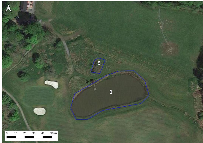
Figur 7. Damm 6

Beskrivning: Bevattningsdamm med pumphus. Tämligen vegetationsfattig både i strandkanten och i vattenmassan. Relativt branta strandkanter samt både grumligt och färgat vatten. Karp i dammen inklusive yngel från dessa (reproduktion). Tidigare observationer av åkergroda i dammen.