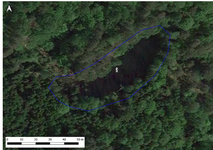
Figur 3. Damm 2

Beskrivning: Omges av blandskog med en del grov tall, ek, bok och gran. En berghäll sluttar brant ner på nordsidan av dammen. Inloppet utgörs av ett mindre vattendrag som avvattnar Lahallsåsen väster om och mynnar i dammens västra del. Utloppet ligger på sydsidan av dammen och utgörs av ett mindre överfallsdämme som upprätthåller vattennivån i dammen. Botten utgörs av lösa sediment med förhållandevis lite undervattensvegetation.