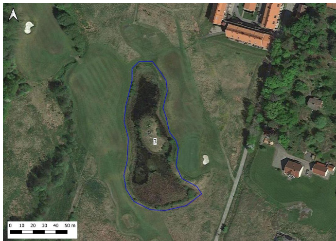
Figur 4. Damm 3

Beskrivning: Grävd damm på golfbana. Flera dräneringsrör mynnar i dammen. Dammen saknar tydligt utlopp. Strandkanterna varierar från flacka i norr till något högre, brantare i södra och östra delarna. Hela dammen omges av ett smalt vassbälte i vilket det står spridda mindre björkar och videbuskar. Vass och buskage röjs dock med jämna mellanrum. Utanför vasskanten ansluter kortklippt gräs på golfbanan.