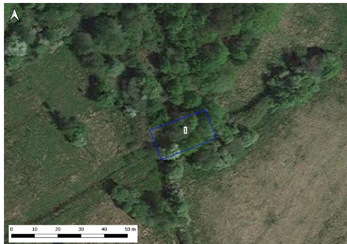
Figur 2. Damm 1