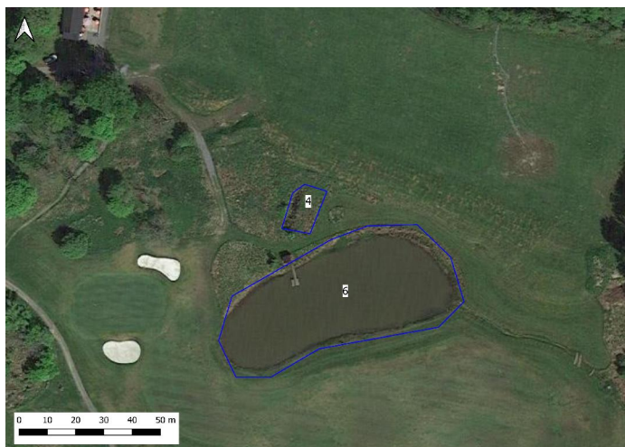
Figur 5. Damm 4