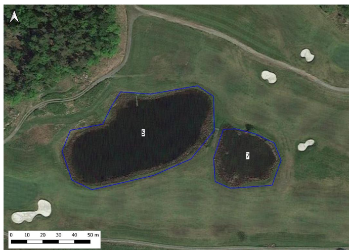
Figur 6. Damm 5 och 7

Beskrivning: Två närliggande dammar förbundna med en kort kulvert. Rikligt med vegetation senare på säsongen, både vattenöverståndare såsom kaveldun, bladvass m.fl. arter och flytvegetation i form av gäddnate. Rikligt med fintrådiga grönalger. Illaluktande sumpgas indikerar tidvis syrebrist i dammen. Karp i dammen (koikarp?) som reproducerar sig (talrikt med yngel). Tidigare observationer i dammen utgörs av åkergroda, vanlig groda och vanlig padda.