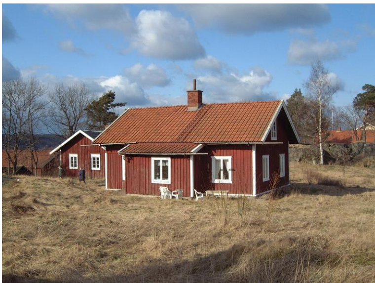
Tjänstebostäder tillhörande kulturmiljön kring Backa säteri.

Planområdet gränsar till Nödinge golfbana i tre väderstreck. Det ger ett öppet läge med fina vyer mot bland annat bevarade åkerholmar och Lodingebäcken, som är klassad som riksintresse för naturvård och hyser ett starkt bestånd av öring. I norr gränsar fastigheten till kommunal mark med äldre tjänstebostäder tillhörande kulturmiljön kring Backa säteri.