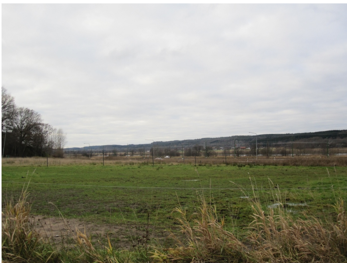
Planområdet är idag en plan gräsyta

Marken består idag av en gräsyta och är i gällande plan betecknad som NATUR, äng.