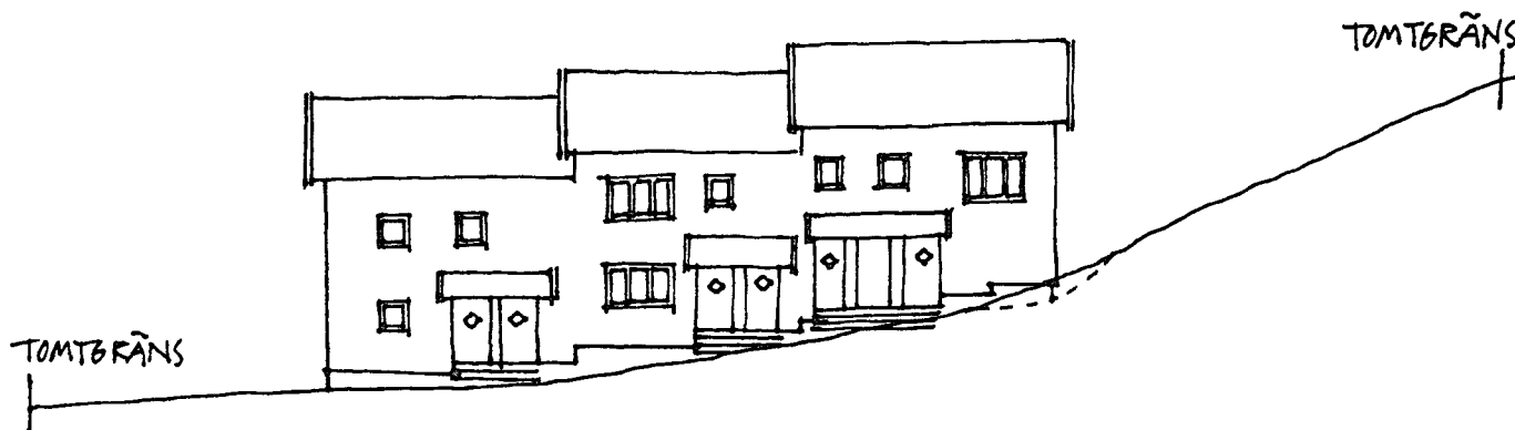
Illustration av föreslagen bebyggelse och placering på tomten:

En äldre butiksfastighet är belägen i tomtens främre del, snett bakom står en liten envånings stuga i trä som avses rivas.