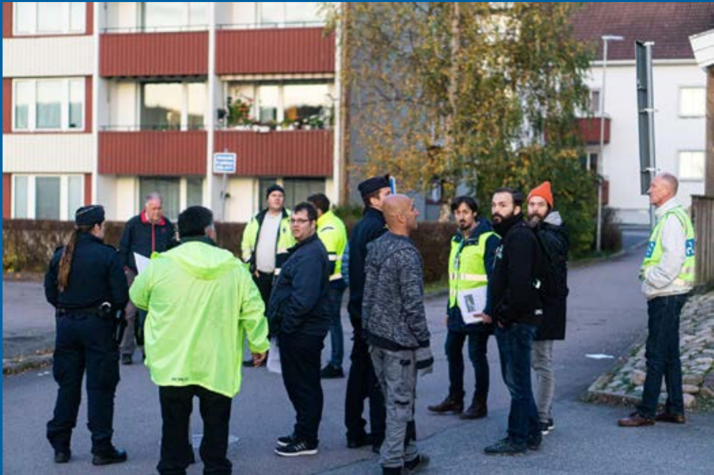
Deltagare i trygghetvandringen i Surte