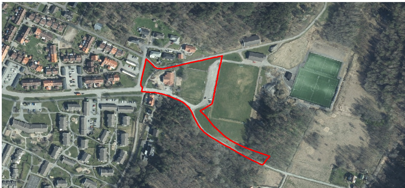
Planområdet illustreras med röd linje

En detaljplan innehåller bestämmelser om hur marken får bebyggas och vad den ska användas till. Detaljplanen är en juridiskt bindande handling och styrs av Plan- och bygglagen (PBL). Allmänna intressen vägs mot enskilda för att nå en god helhetslösning och planen ligger sedan till grund för beslut om till exempel bygglov.