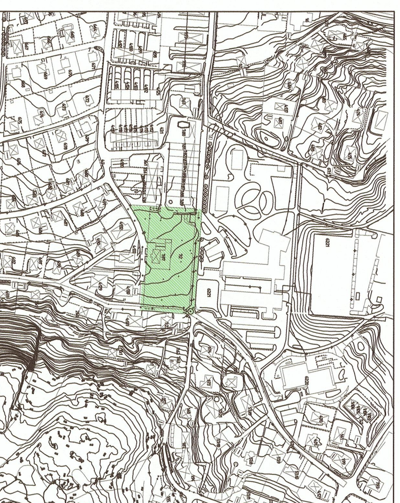
ORIENTERINGSKARTA SKALA 1:4000