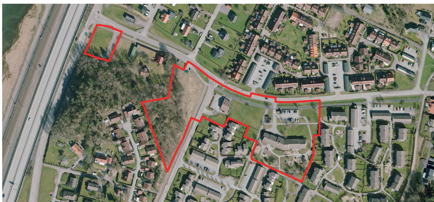
Planområdet illustreras med röd linje

En detaljplan innehåller bestämmelser om hur marken får bebyggas och vad den ska användas till. Detaljplanen är en juridiskt bindande handling och styrs av Plan- och bygglagen (PBL). Allmänna intressen vägs mot enskilda för att nå en god helhetslösning och planen ligger sedan till grund för beslut om till exempel bygglov.