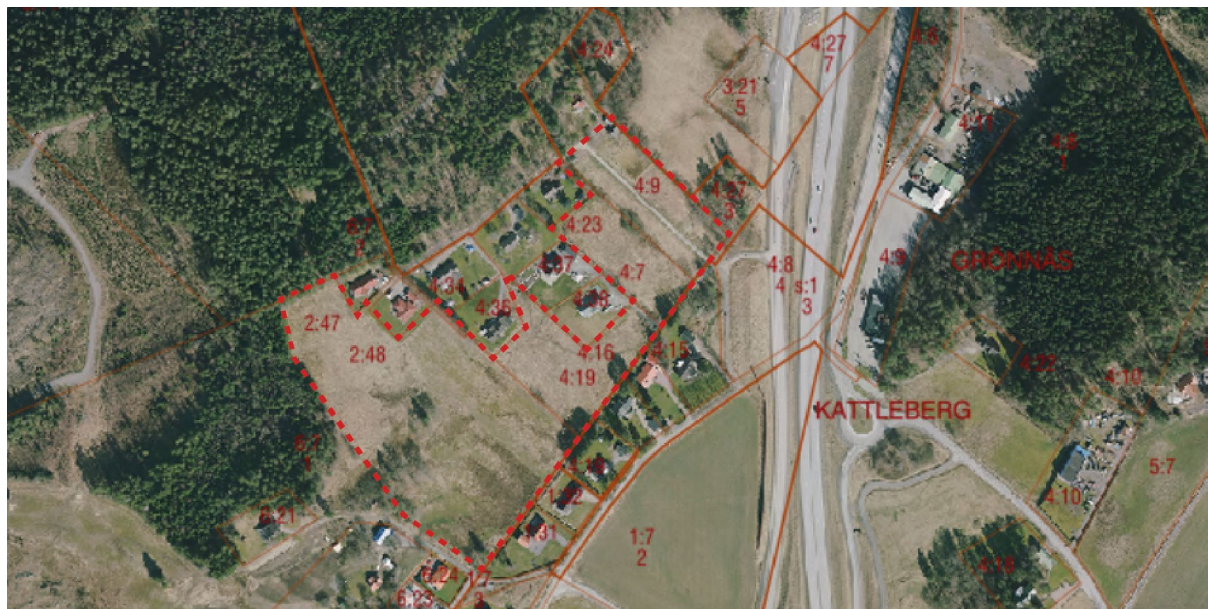
Ungefärlig planavgränsning för detaljplanen markerad med röd linje.

Planområdet omfattar ca 9 ha och ligger väster om E45 intill Kattleberg, ca 5 km norr om Älvängen. Marken utgörs idag av öppen hagmark. Planområdet ligger i utkanten av det av Länsstyrelsen utpekade ”regionalt värdefulla odlingslandskapet för Grönåns dalgång”.